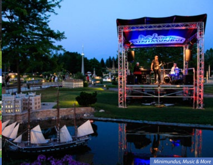
Minimundus, Music & More