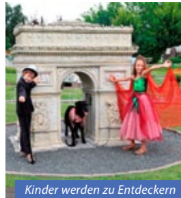
Kinder werden zu Entdeckern