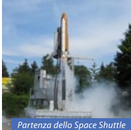
Partenza dello Space Shuttle