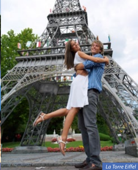
La Torre Eiffel