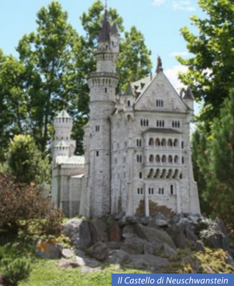
Il Castello di Neuschwanstein