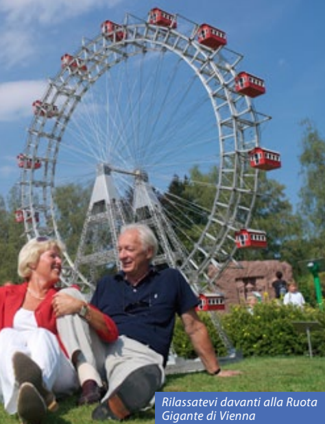
Rilassatevi davanti alla Ruota Gigante di Vienna