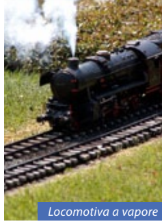
Locomotiva a vapore