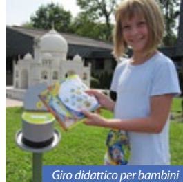
Giro didattico per bambini