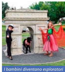
I bambini diventano esploratori