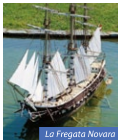
La Fregata Novara