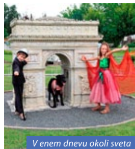
V enem dnevu okoli sveta