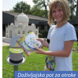
Doživljajska pot za otroke