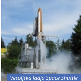
Vesoljska ladja Space Shuttle